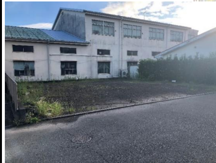
↑物件西側からの撮影