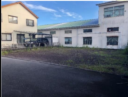
↑幅員6.0mの広々とした前面道路